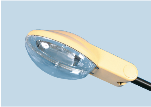
Dimensions in mm