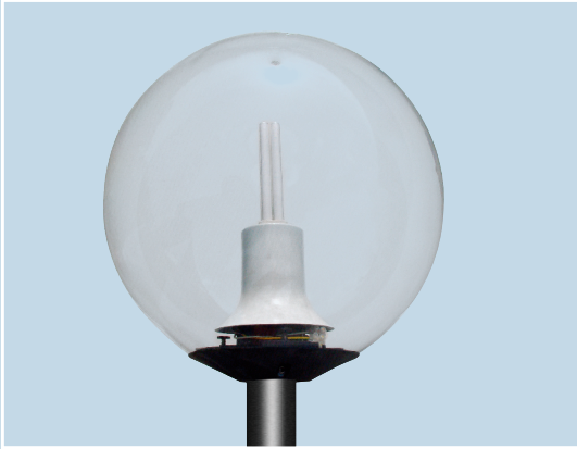
Dimensions in mm