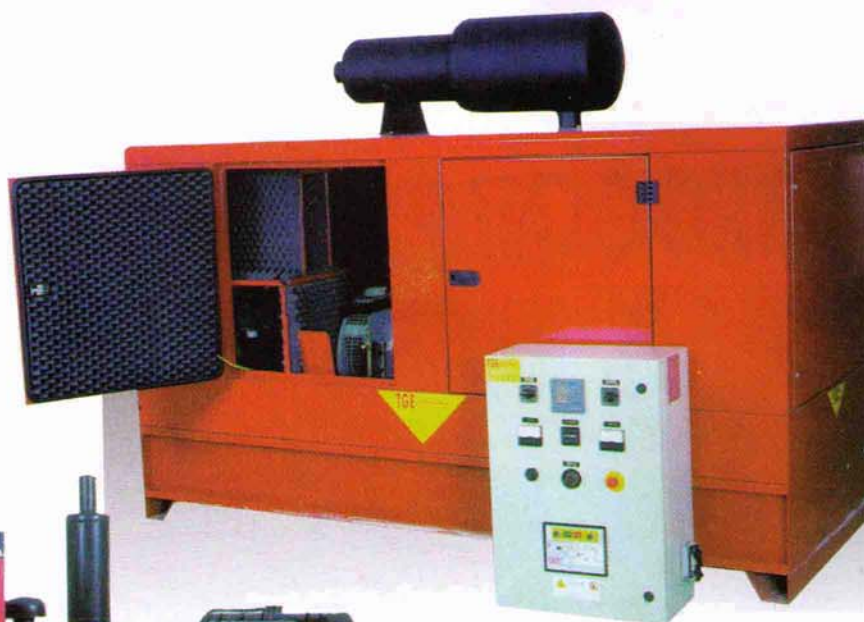
Groupe électrogène capote insonorisée