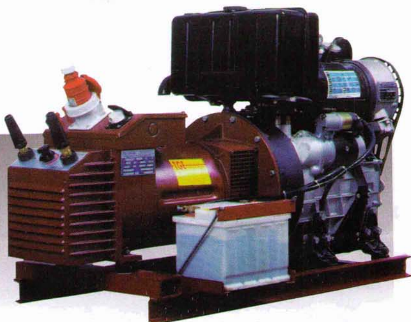
Moto soudeuse MS 240