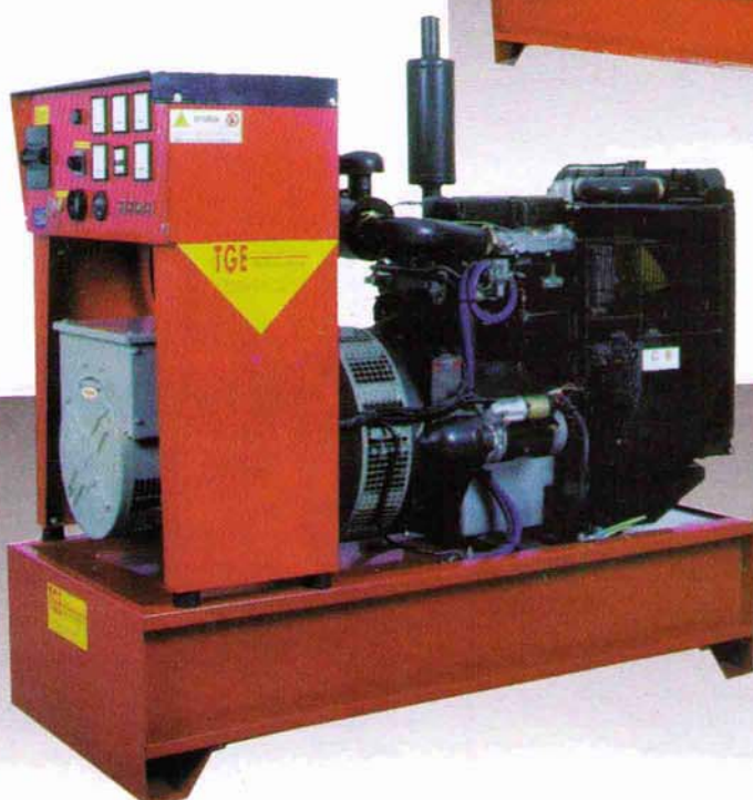
Groupe électrogène sur chassis SKID