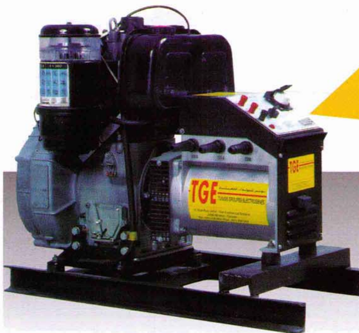
Moto soudeuse MS 180